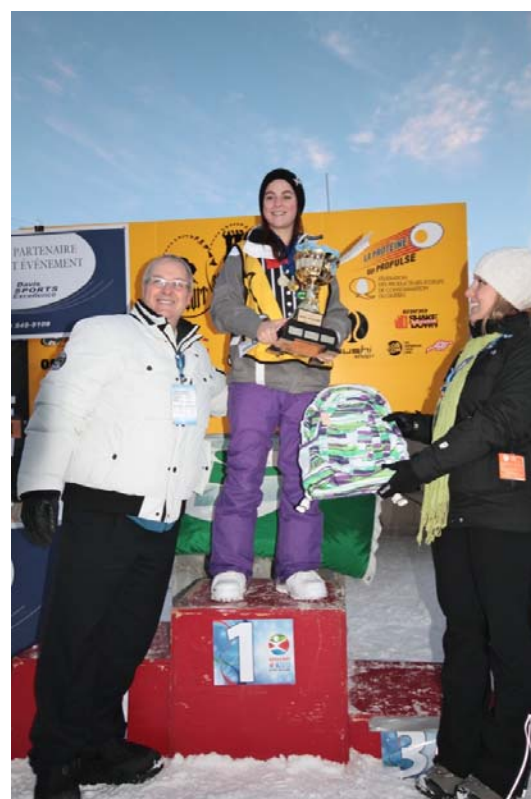
Finale régionale des jeux au mont Fortin à Jonquière